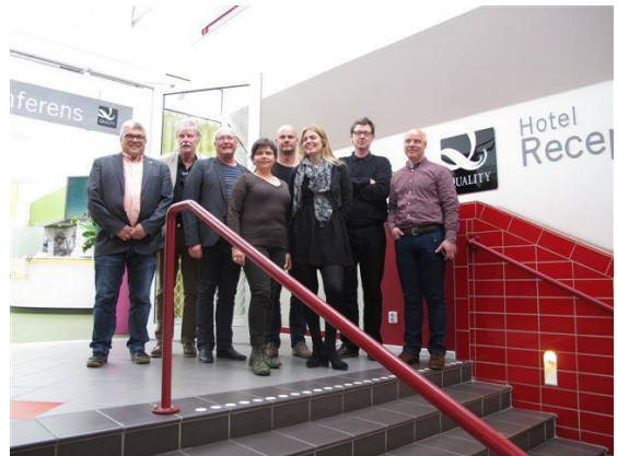
Elever från Kom-igång kursen